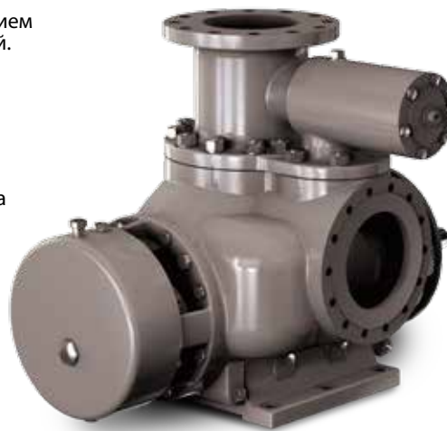
2HM Horizontal General Twin Screw Pump, WTG