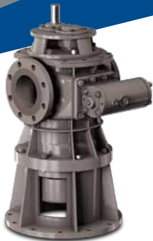
2VM Vertical General Twin Screw Pumps, WTG