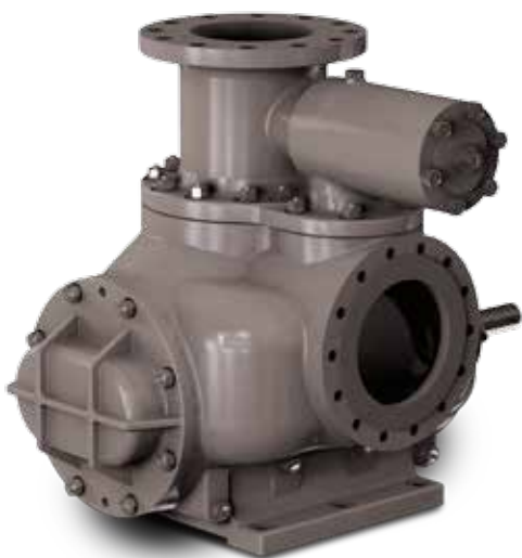
2HE Horizontal General Twin Screw Pump