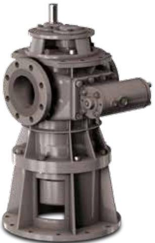
2VR Vertical General Twin Screw Pumps, WTG