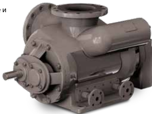
2HC Twin Screw Pump, WTG