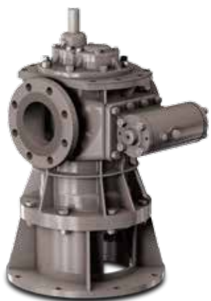
2VE Vertical General Twin Screw Pumps, WTG